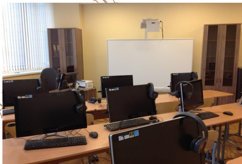
Кабинет иностранного языка (лингвфонный)