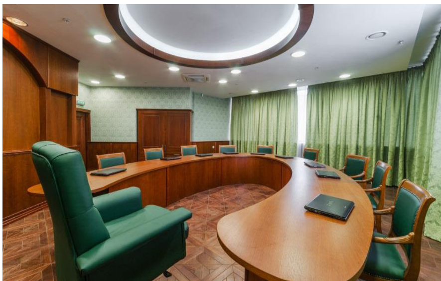
Аудитория для проведения семинарских занятий по теоретическим дисциплинам

Учебные аудитории и помещения «Высшей школы сценических искусств», расположенные по адресу: г. Москва, ул. Шереметьевская д. 6, корп. 2, позволяют проводить все виды учебных занятий по дисциплинам, предусмотренным учебным планом по специальности 070301/52.05.01 Актерское искусство, и соответствуют действующим санитарным и противопожарным нормам.