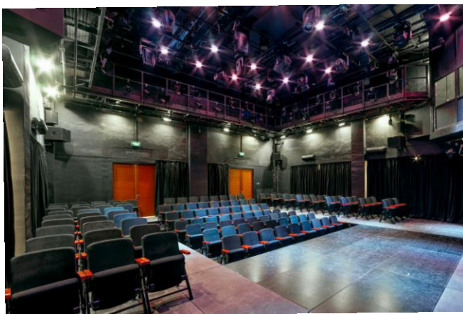
Учебный театр Открытый амфитеатр