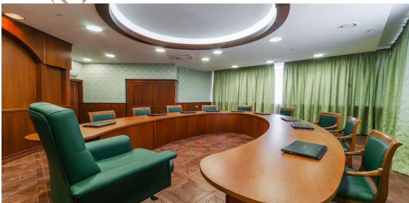
Аудитория для проведения семинарских занятий по теоретическим дисциплинам